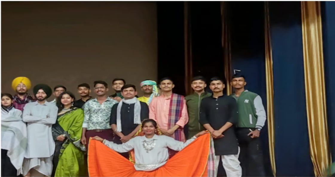
CELEBRATION OF WORLD ORAL HEALTH DAY (20/03/2023)